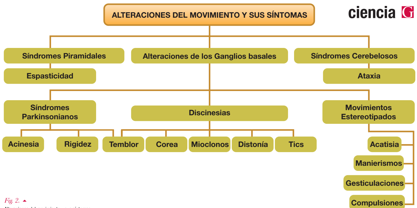
Fig 2. ▲ Alteraciones del movimiento y sus síntomas

Discinesias. Movimientos involuntarios anormales que afectan principalmente a las extremidades, tronco o mandíbula y que ocurren como manifestación de un proceso patológico subyacente. Las discinesias son también manifestación, relativamente común, de las enfermedades de los ganglios basales.